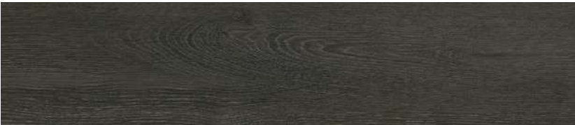
BLACK ZSB8 20 X 90 CM.