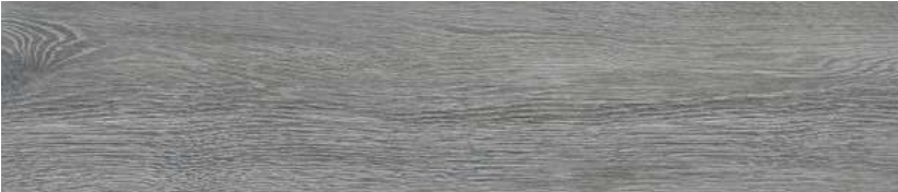
GRAY ZSB6 20 X 90 CM.